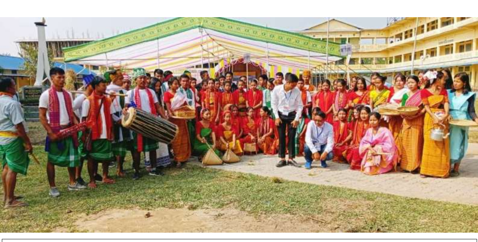
Ethnic Cultural Troup of Golden Jubilee Celebration, Gossaigaon College, Gossaigaon