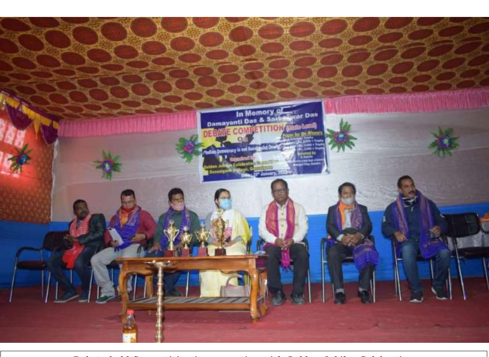
Debate held Competition in connection with Golden Jubilee Celebration