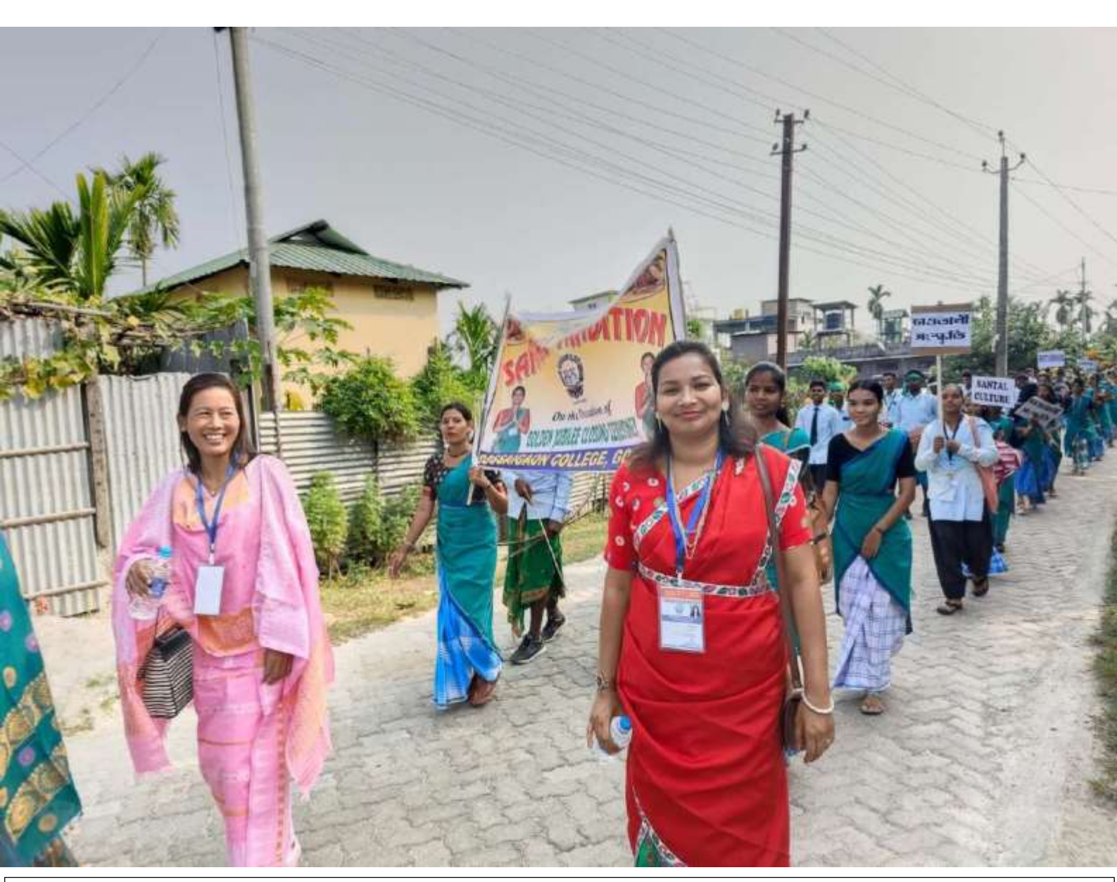
Cultural Rally on the occasion of closing ceremony of Golden Jubilee Celebration, Gossaigaon College, Gossaigaon