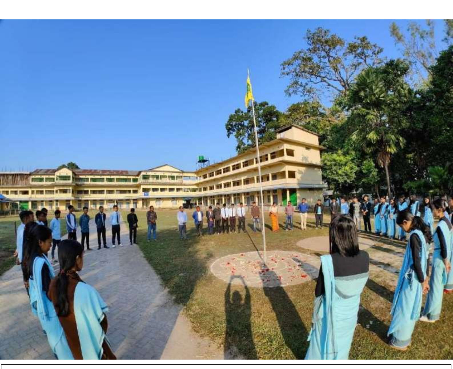
Observation of Bodo Literary Day