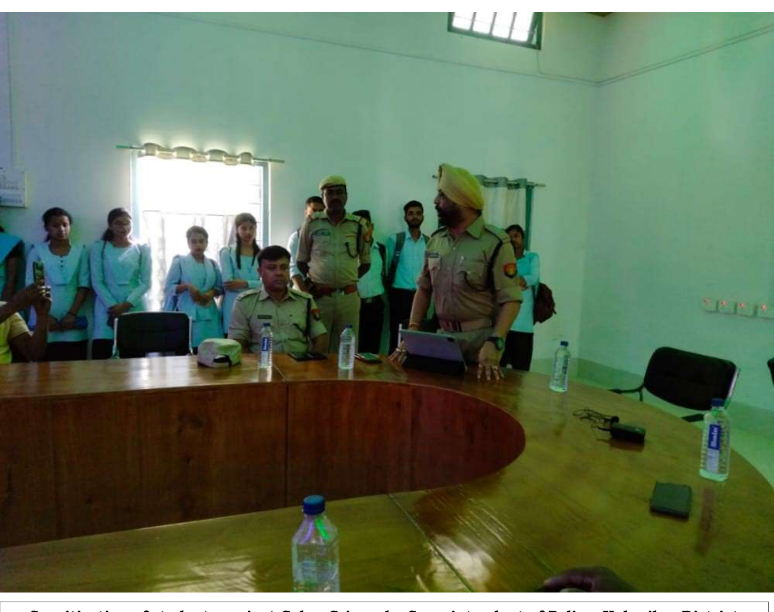
Sensitization of students against Cyber Crimes by Superintendent of Police, Kokrajhar District