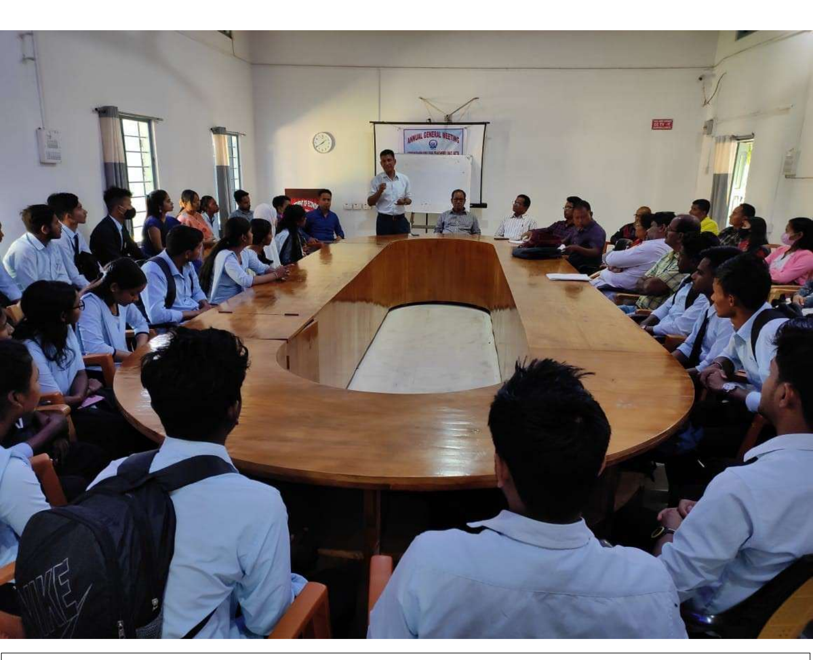
Interaction with Academic Registrar, Bodoland University