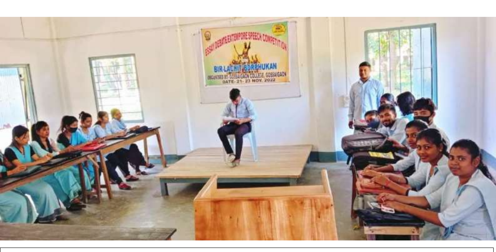
Debate Competition held in connection with BIR-Lachit Divas