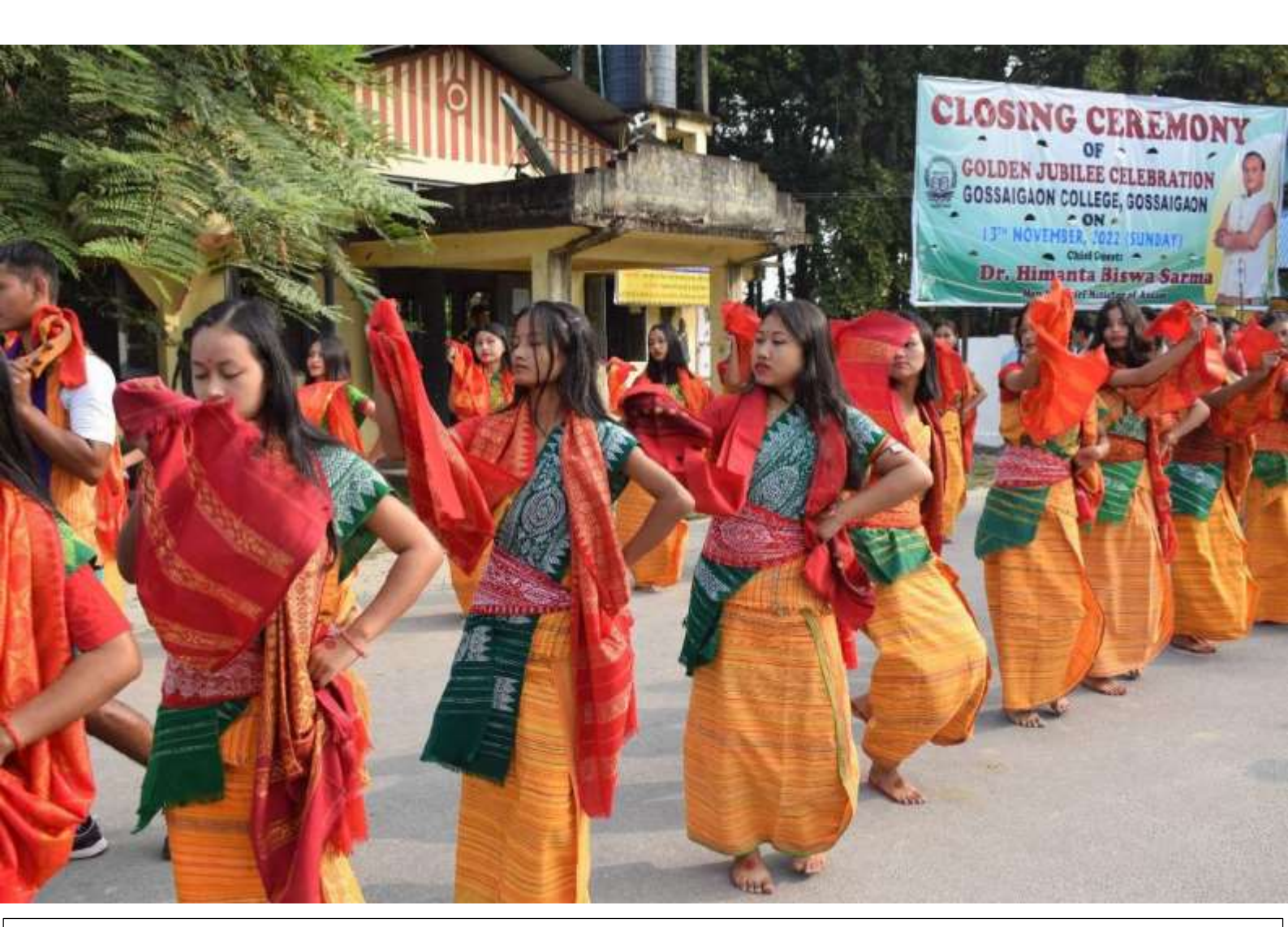
Cultural Rally on the occasion of closing ceremony of Golden Jubilee Celebration, Gossaigaon College, Gossaigaon