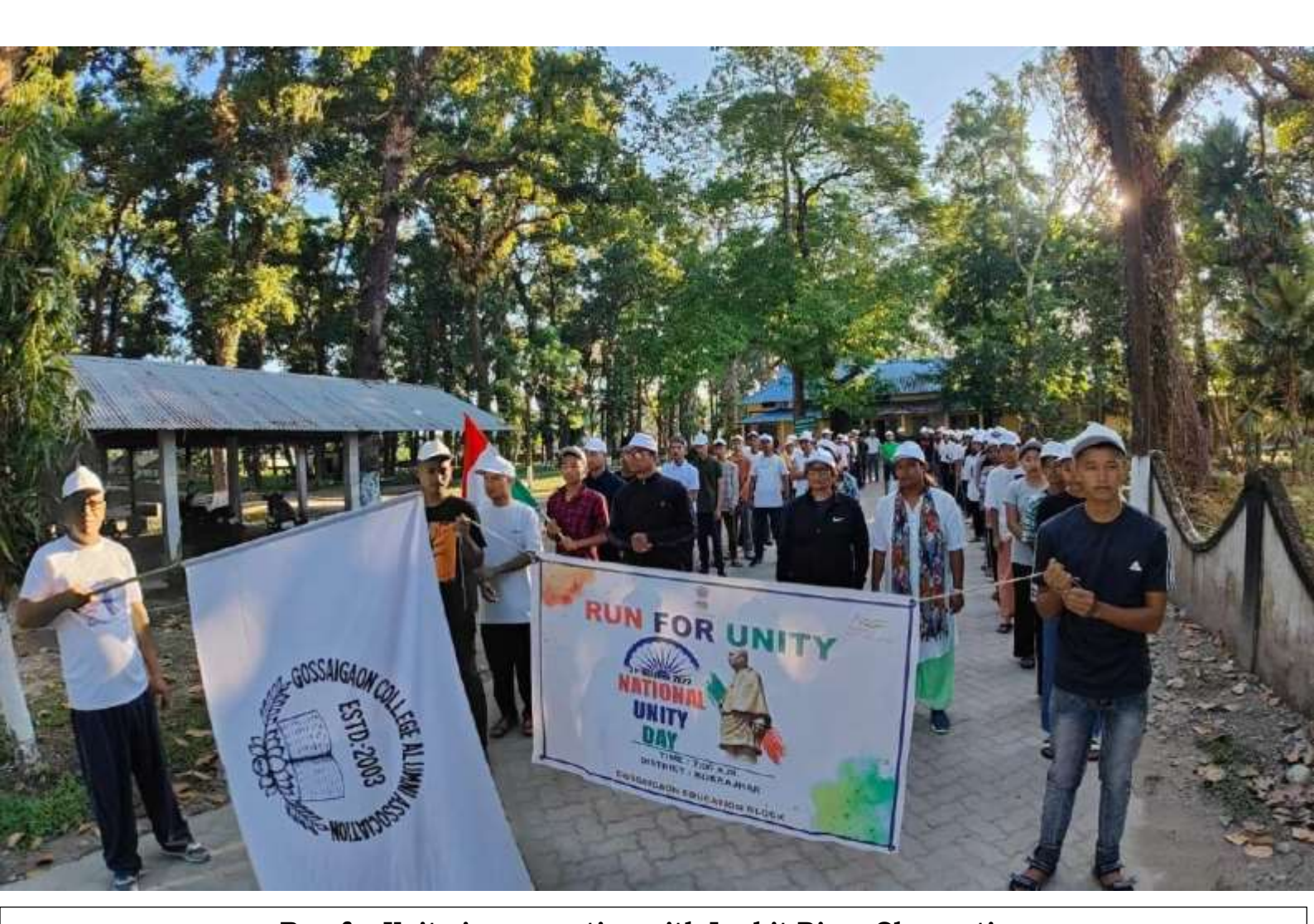
Run for Unity in connection with Lachit Divas Observation