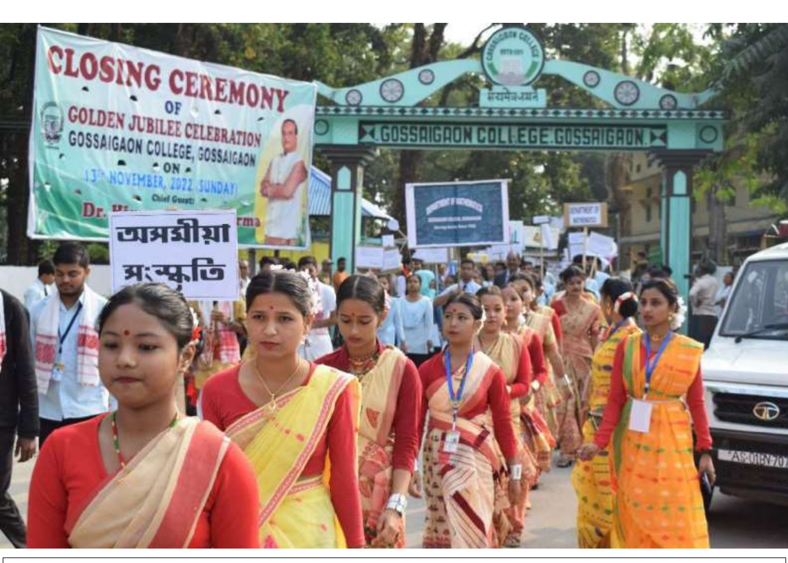
Cultural Rally on the occasion of closing ceremony of Golden Jubilee Celebration, Gossaigaon College, Gossaigaon