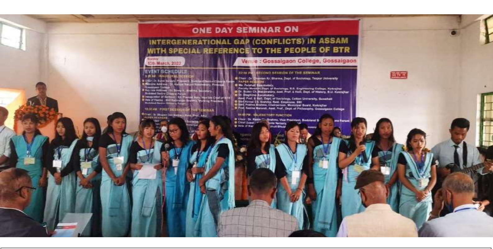
Seminar on Intergenerational Gap (Conflicts) in Assam