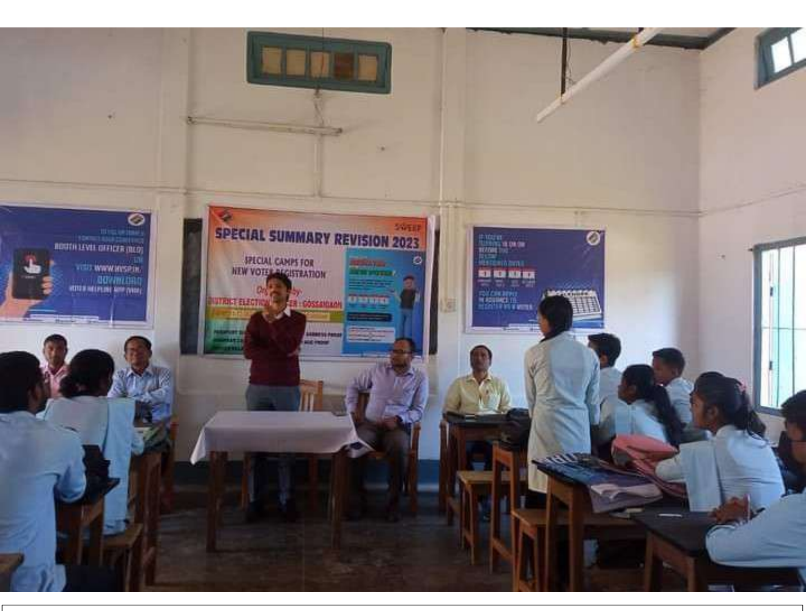
Speech by Hon'ble S.D.O. (Civil), Gossaigaon on the Occasion of Awareness Programme for New Voter's Registration