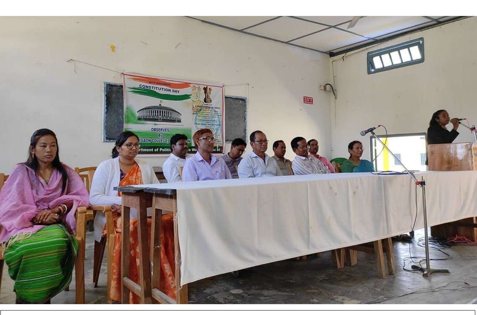
Observation of Constitutional Day 2021