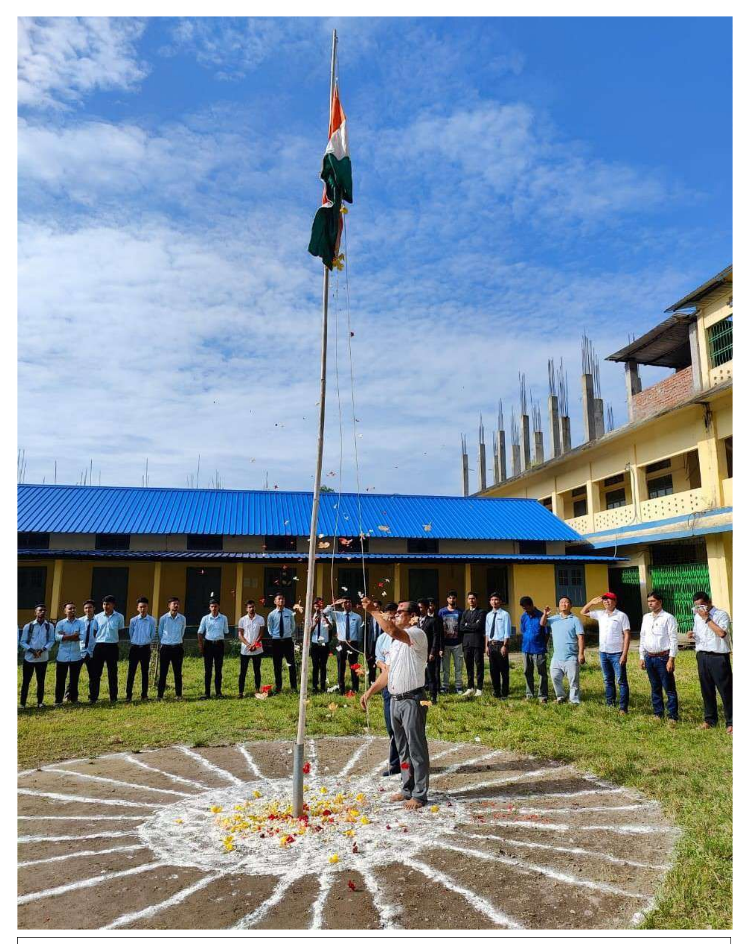
Flag hosting on the occasion of Independence Day