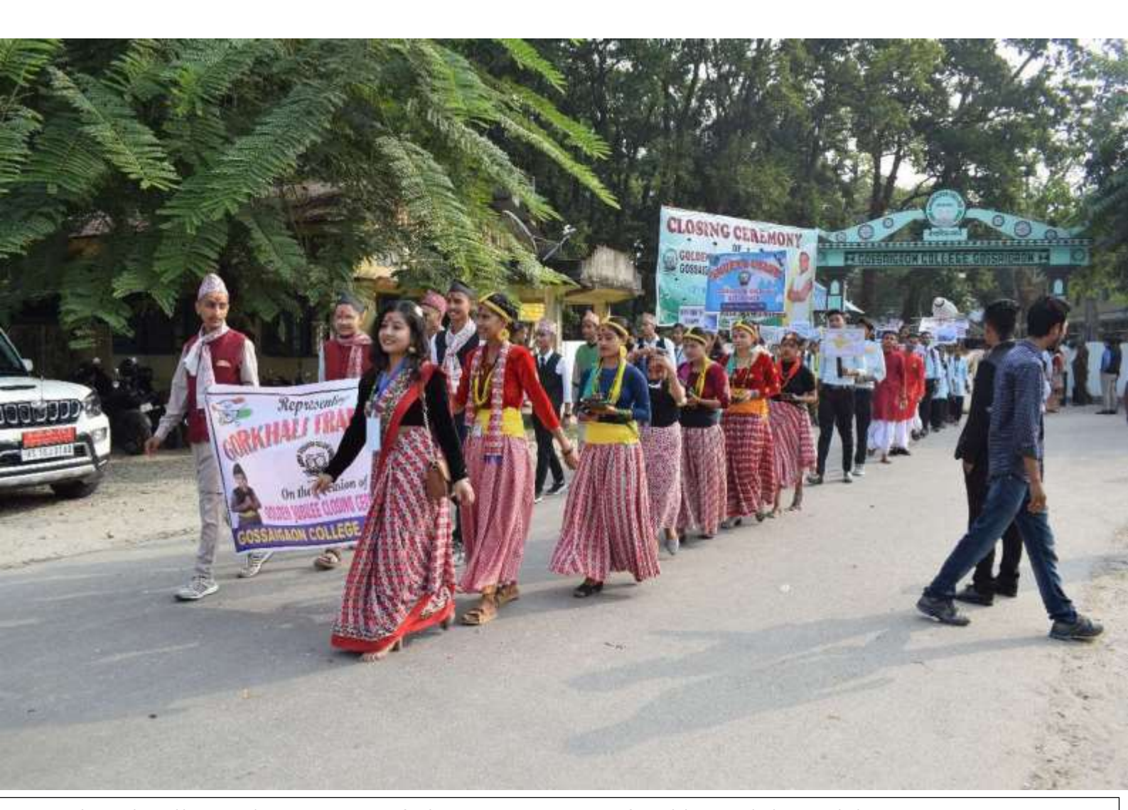
Cultural Rally on the occasion of closing ceremony of Golden Jubilee Celebration, Gossaigaon College, Gossaigaon