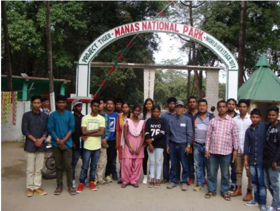
Field Tour to Manas National Park, Barpeta, Assam, Dept. of Zoology