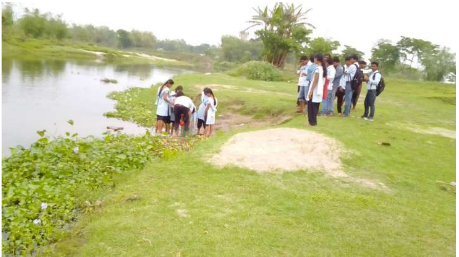
Field Survey on aquatic fauna at Modati River, Gossaigaon, Assam, Dept of Zoology