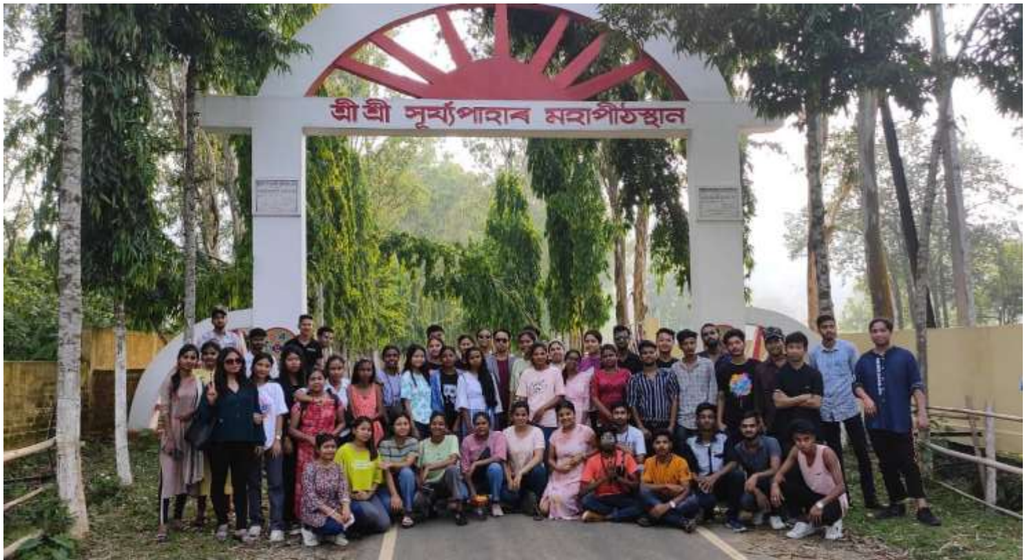
Field Survey at Sri Sri Surya Paha, Goalpara, Assam, Dept. of English