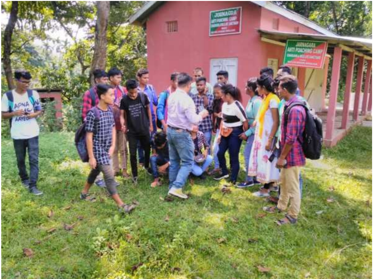
Field Tour at Chakrashila Wildlife Sanctuary, Kokrajhar, Assam, Dept. of Zoology