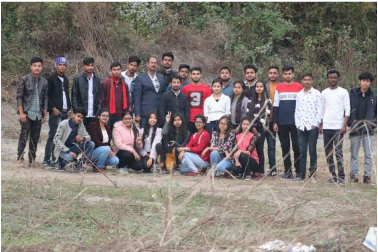
Field Tour at Jamduar Reserve Forest, Dept. of Mathematics