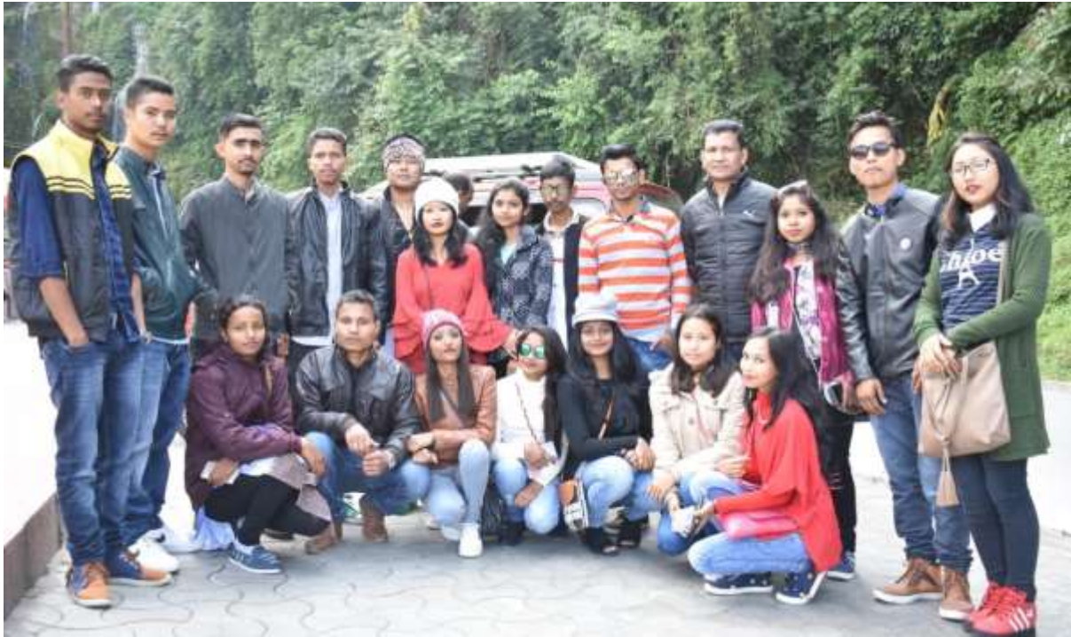
Field Tour at Skkim, Gangtok, Dept. of Geography