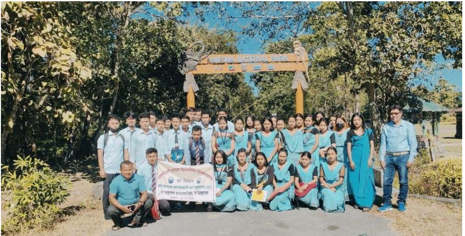
Field Tour at Raimona National Park, Gossaigaon, Assam, Dept. of Bodo