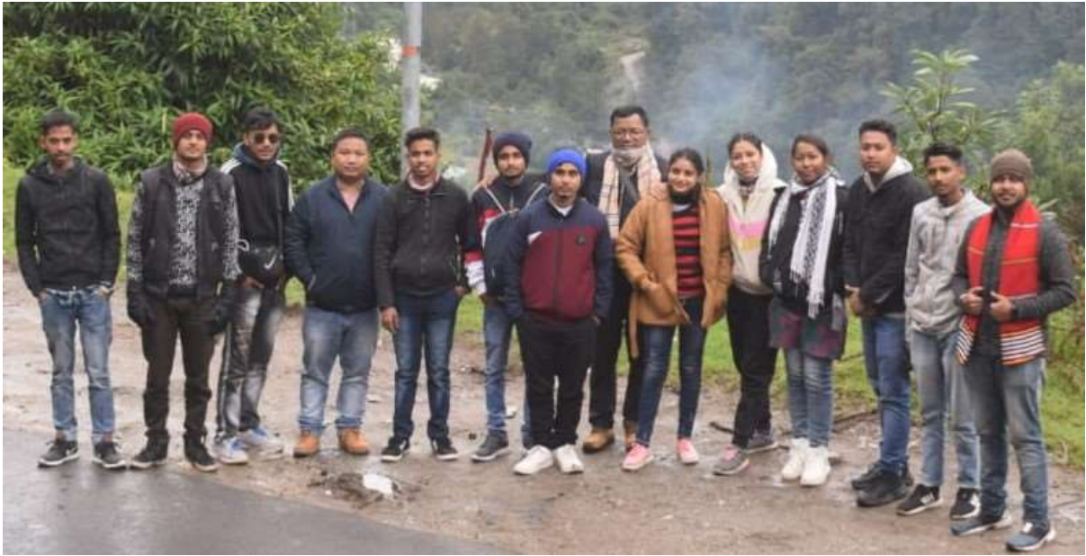
Field Trip to Darjeeling, WB, Dept. of Geography