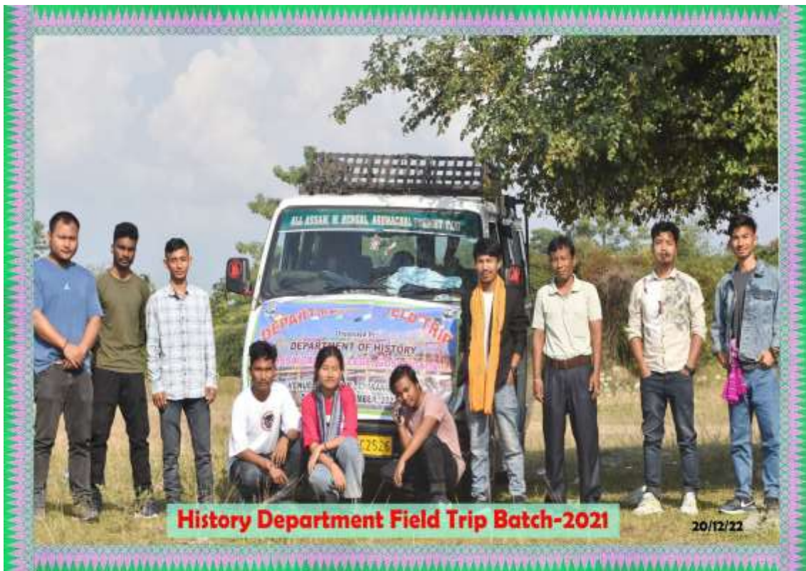
Field Trip to Chirang District, Dept. of History