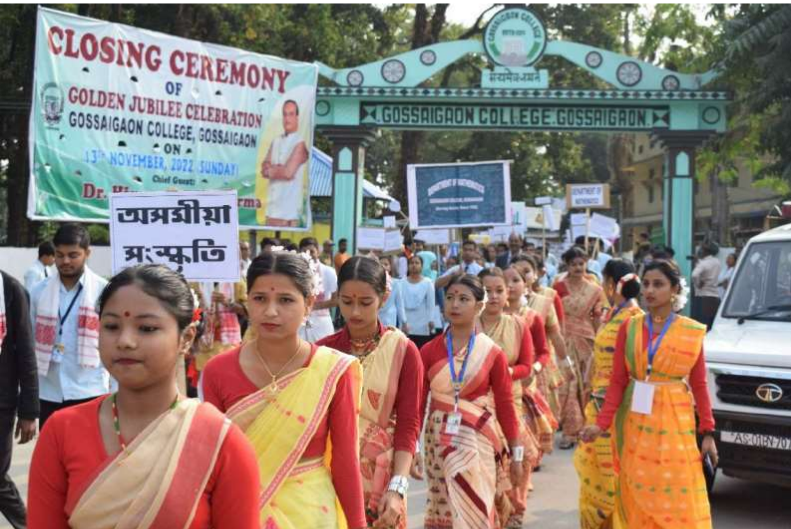
Cultural Rally on the occasion of closing ceremony of Golden Jubilee Celebration, Gossaigaon College, Gossaigaon