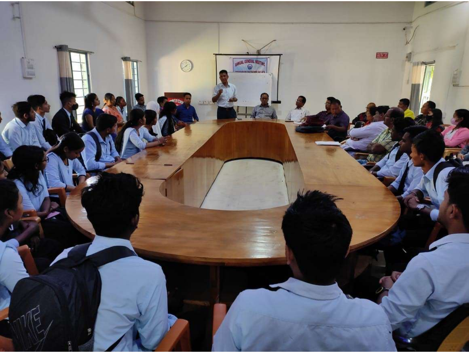
Interaction with Academic Registrar, Bodoland University