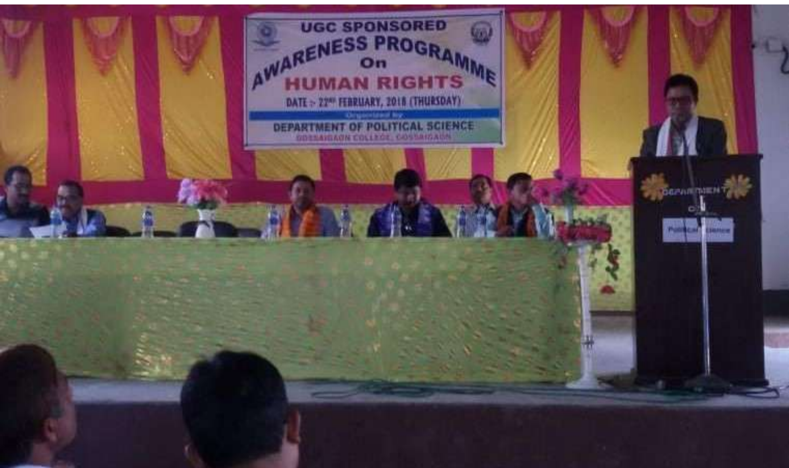
Awareness Programme on Human Rights 2018