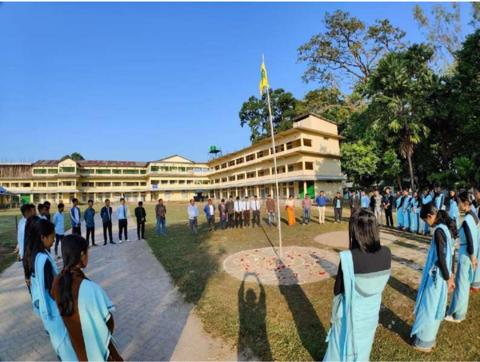
Observation of Bodo Literary Day