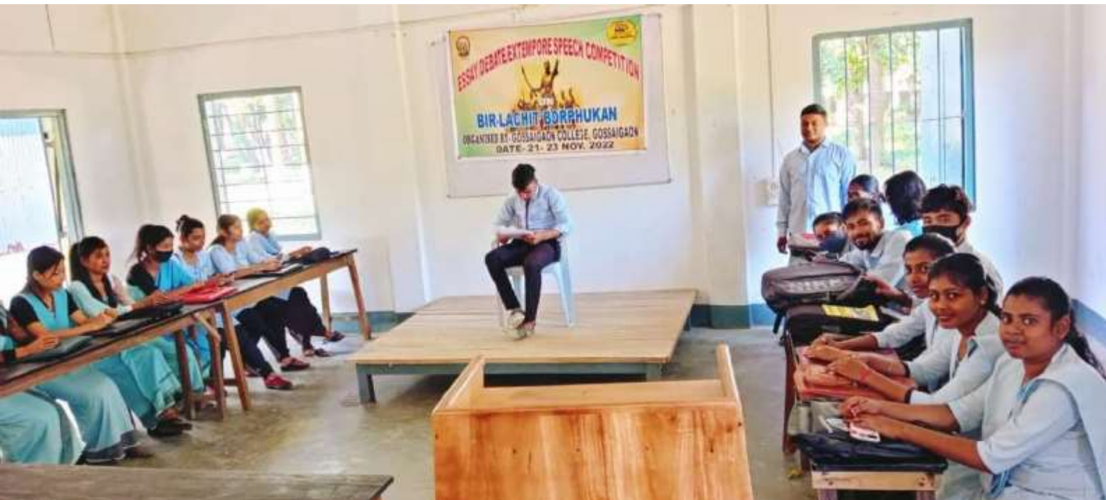
Debate Competition held in connection with BIR-Lachit Divas