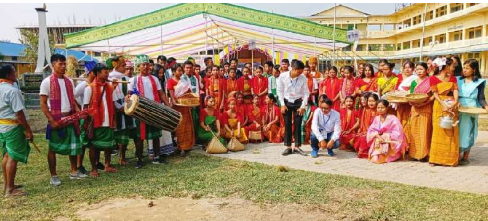
Ethnic Cultural Troup of Golden Jubilee Celebration, Gossaigaon College, Gossaigaon