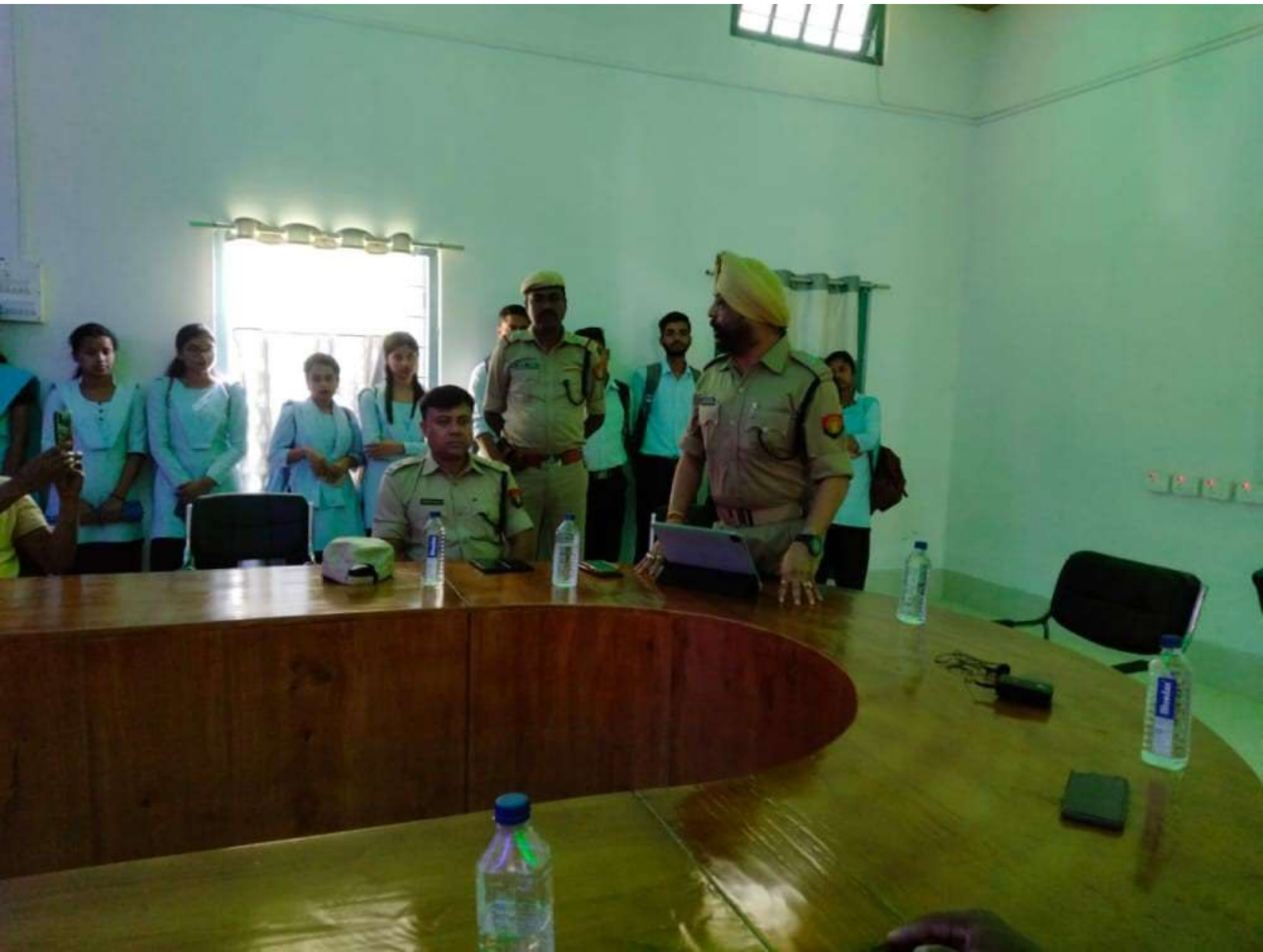
Sensitization of students against Cyber Crimes by Superintendent of Police, Kokrajhar District