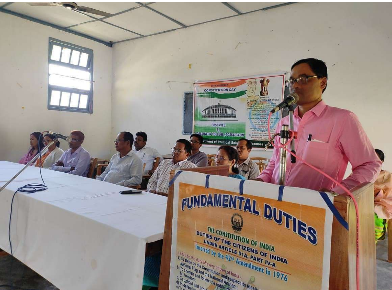
Observation of Constitutional Day to commemorate Dr. B.R. Ambedkar 2022