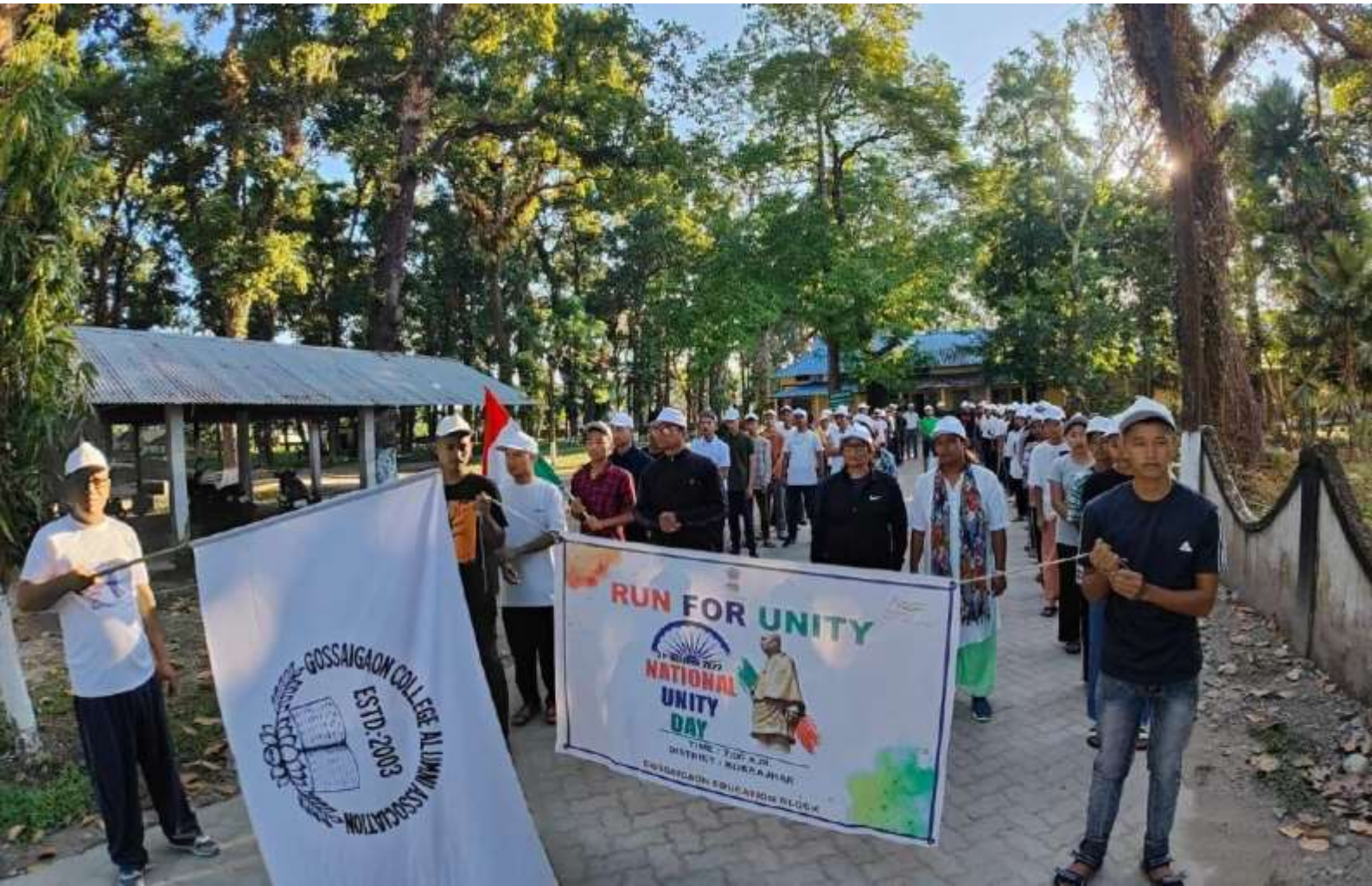
Run for Unity in connection with Lachit Divas Observation