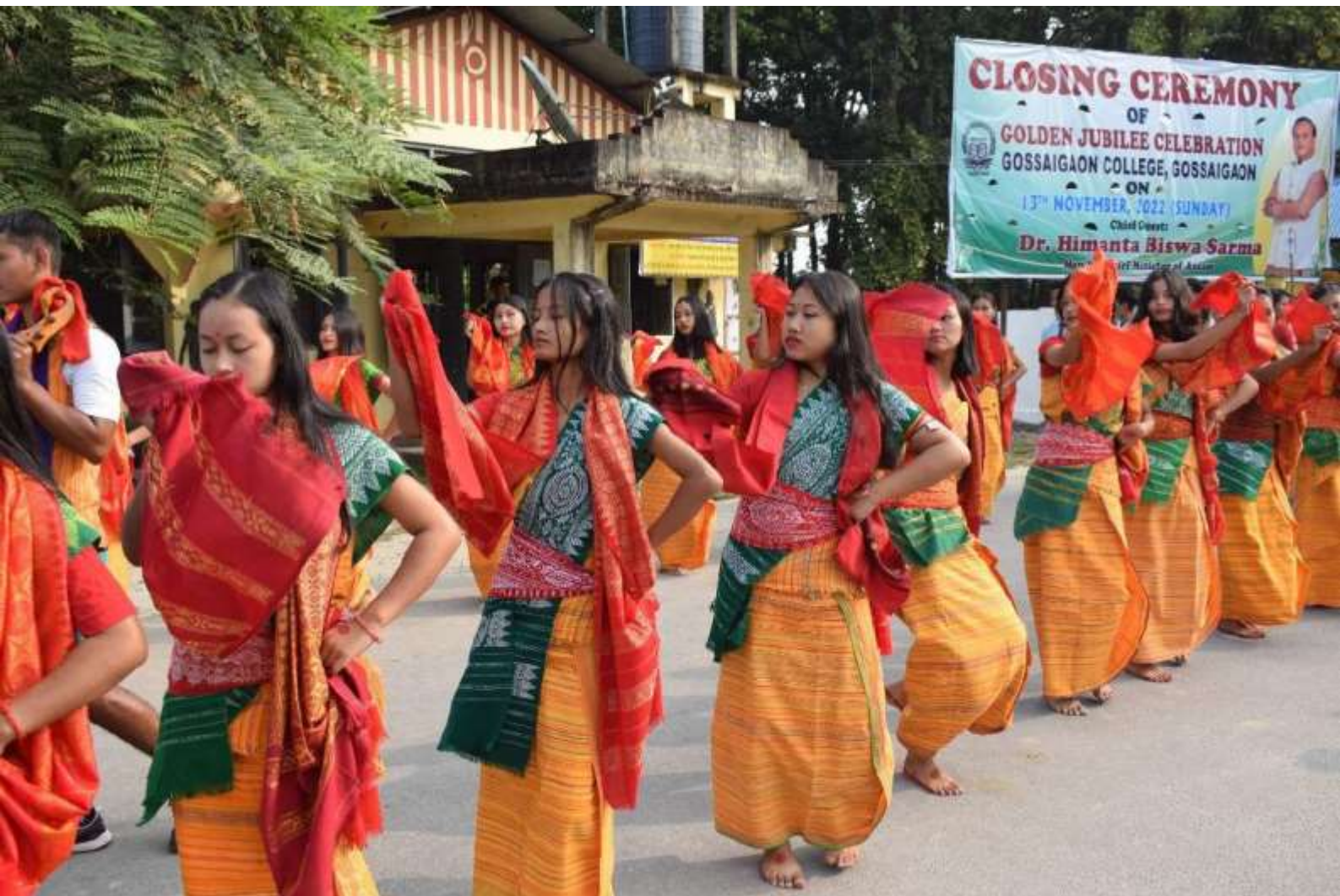
Cultural Rally on the occasion of closing ceremony of Golden Jubilee Celebration, Gossaigaon College, Gossaigaon