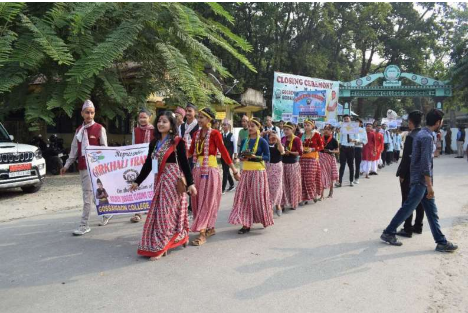
Cultural Rally on the occasion of closing ceremony of Golden Jubilee Celebration, Gossaigaon College, Gossaigaon