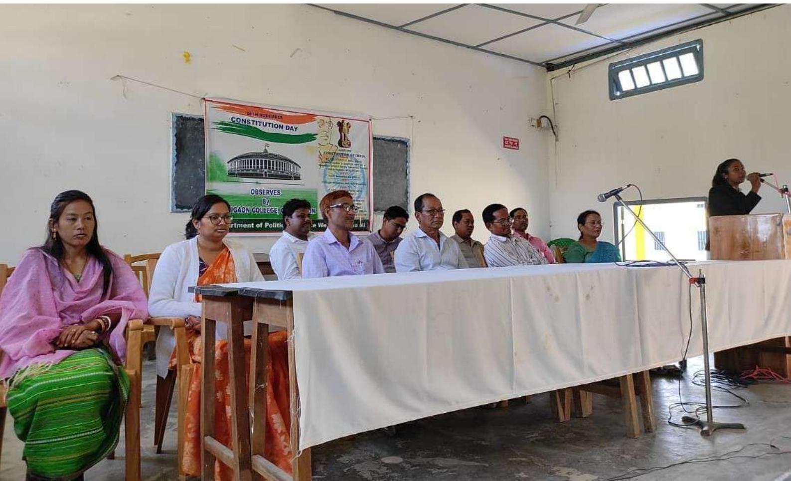
Observation of Constitutional Day 2021