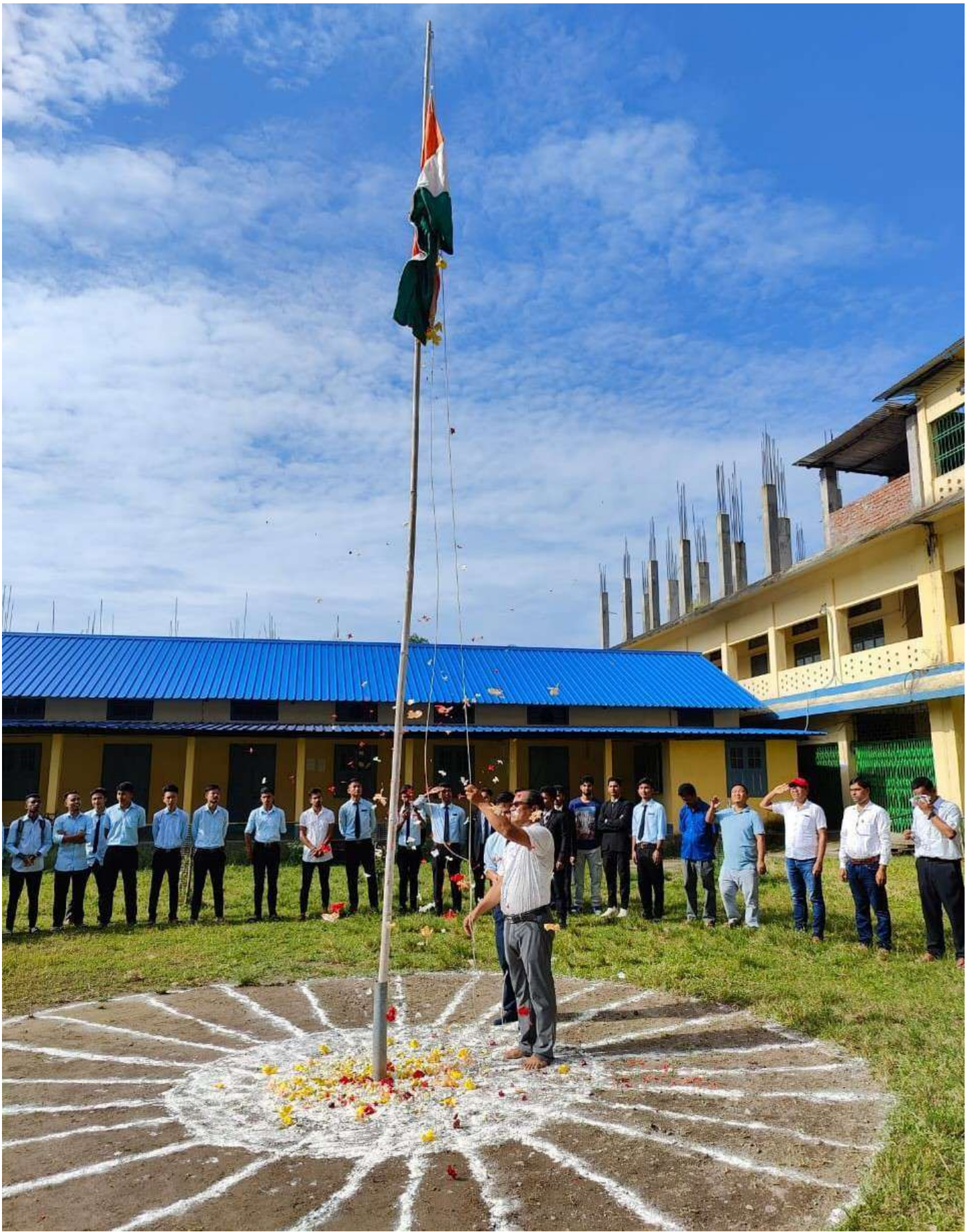
Flag hosting on the occasion of Independence Day