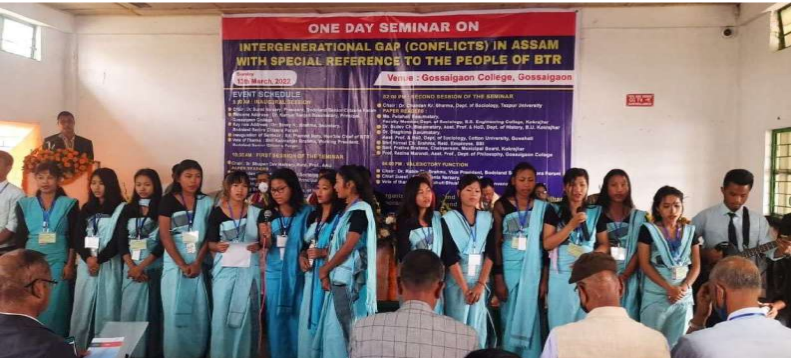
Seminar on Intergenerational Gap (Conflicts) in Assam