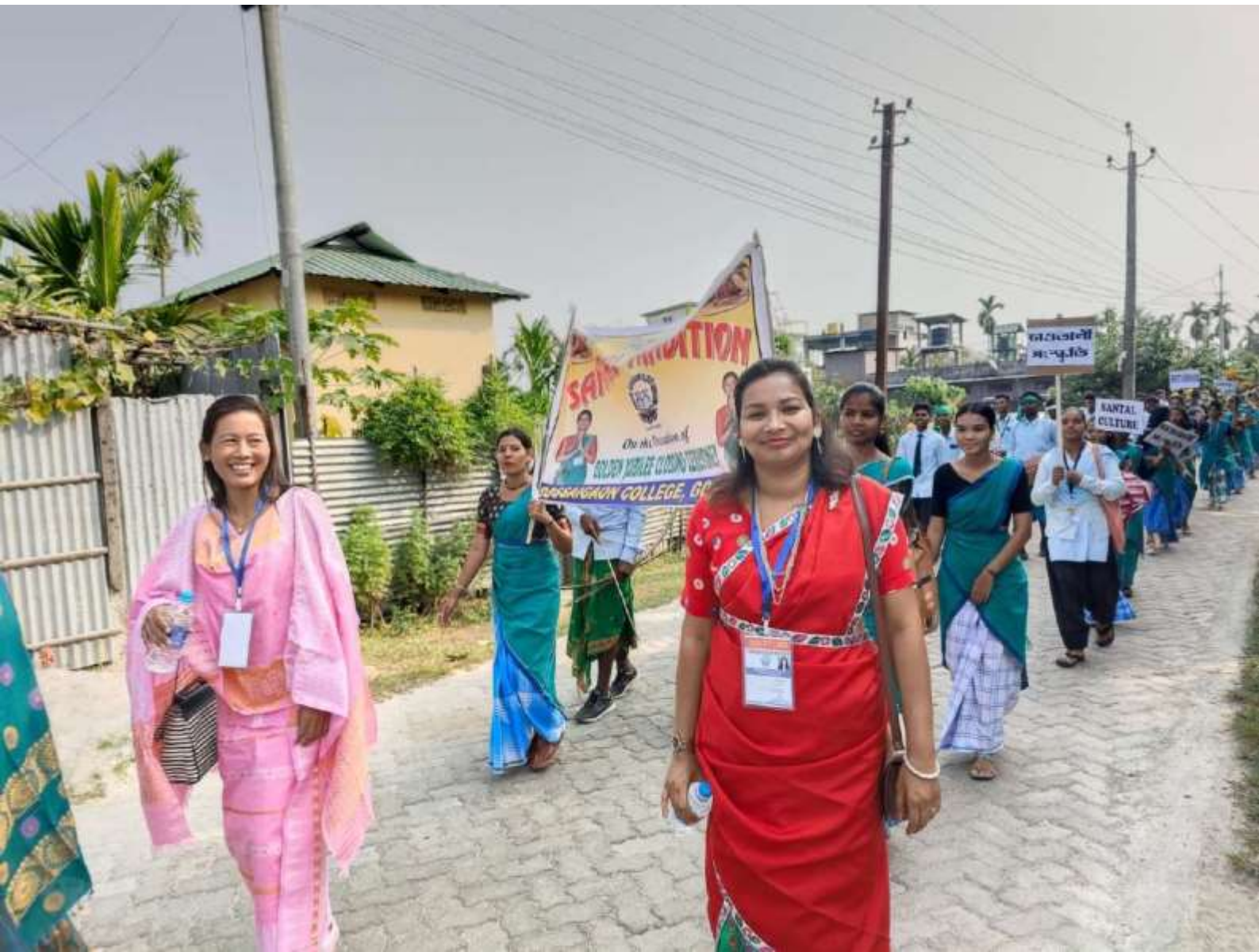
Cultural Rally on the occasion of closing ceremony of Golden Jubilee Celebration, Gossaigaon College, Gossaigaon