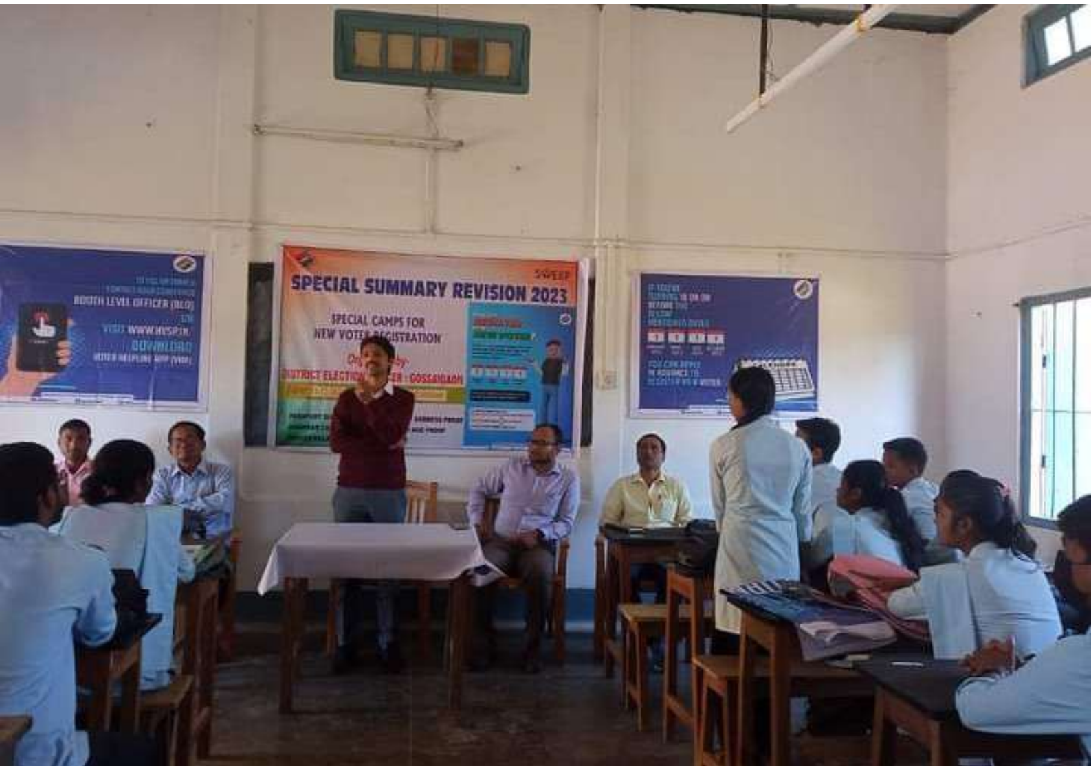
Speech by Hon'ble S.D.O. (Civil), Gossaigaon on the Occasion of Awareness Programme for New Voter's Registration