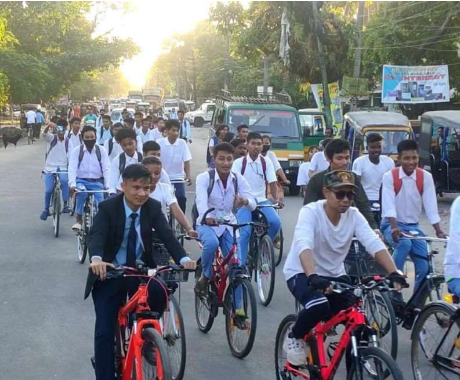
Bi-Cycle Rally in connection with Lachit Divas