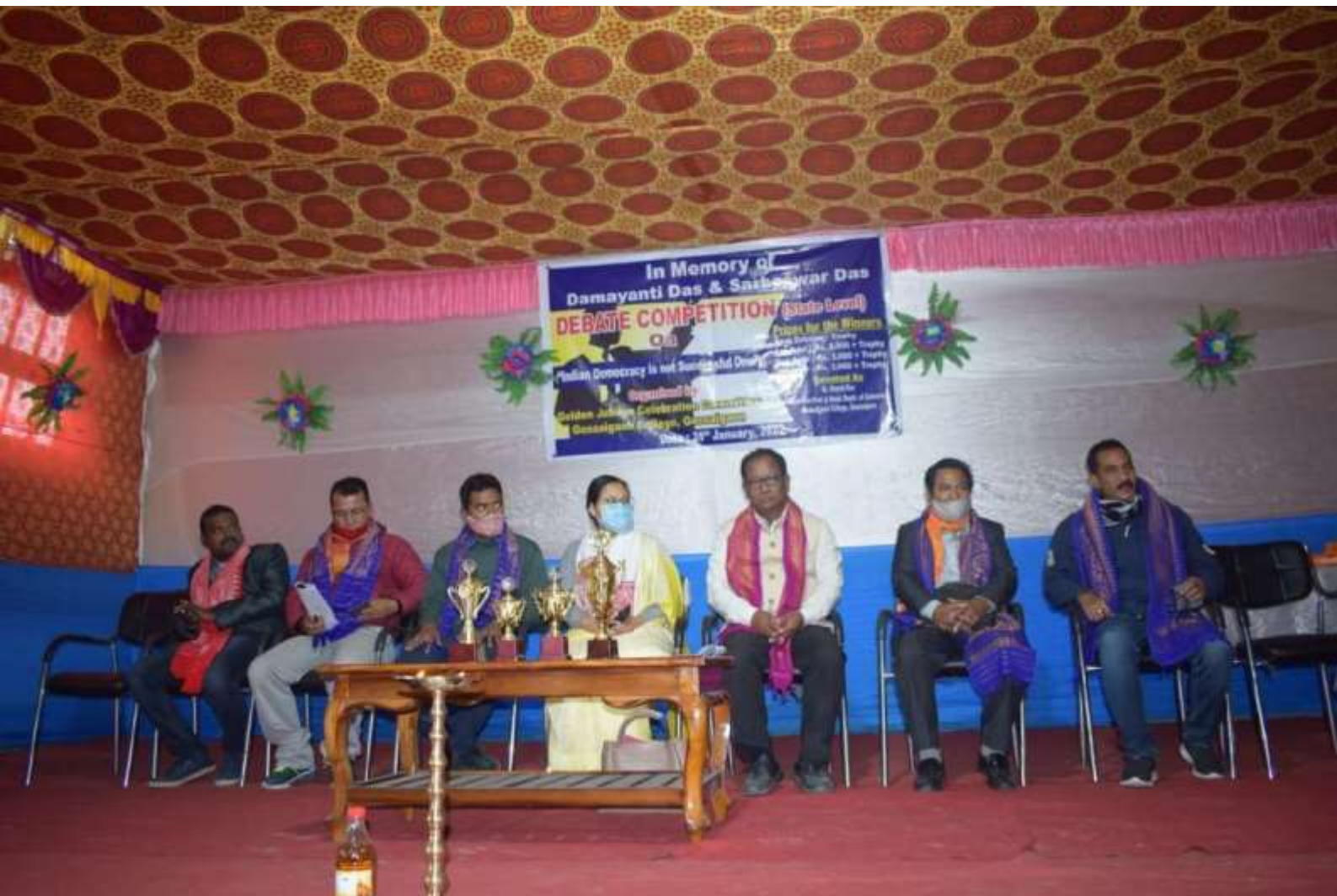
Debate held Competition in connection with Golden Jubilee Celebration